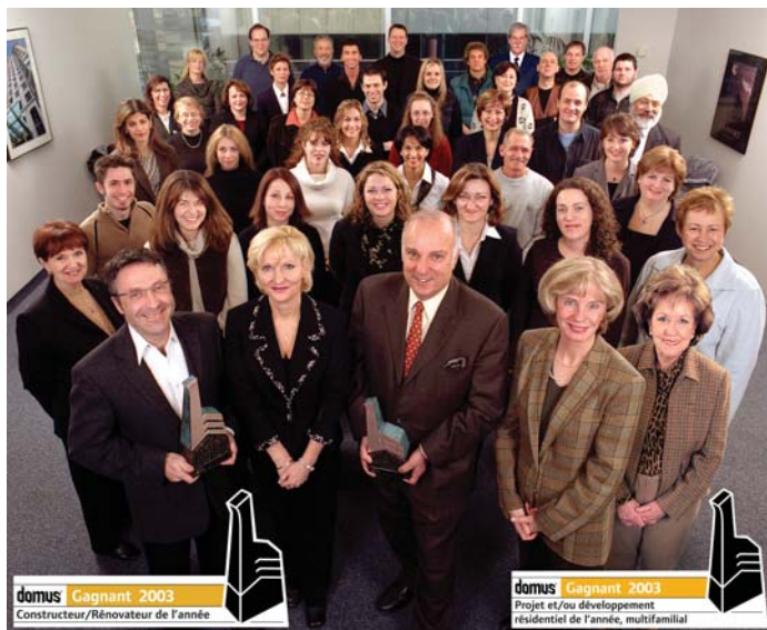
domus Gagnant 2003 Constructeur/Rénovateur de l'année

Ces prix s'ajoutent d'ailleurs à une longue liste de récompenses qui témoignent de la constante recherche de l'excellence dont a su faire preuve Proment au fil des ans. En effet, c'est la quatrième fois que la Corporation Proment se voit ainsi honorée du titre de Constructeur de l'année. Elle s'est vu décerner cette distinction en 1991 pour les Verrières sur le Fleuve et le Club Marin, puis en 1997 pour le Domaine de la Forêt et le Cours du Fleuve et, enfin, en 2001 pour le Club Marin III et à nouveau pour le Domaine de la Forêt.