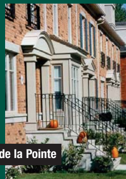
Le Domaine de la Pointe

L'Association provinciale des constructeurs d'habitations du Québec (APCHQ) vient de décerner à la Corporation Proment le titre convoité de « Constructeur de l'année » pour l'année 2003. Cette fois-ci, la Corporation Proment remporte le titre pour les projets du Domaine de la Pointe, des Jardins des Vosges et des Sommets sur le Fleuve, totalisant au-delà de 100 millions de dollars pour la construction de plus de 300 unités d'habitation à l'Île des Sœurs.