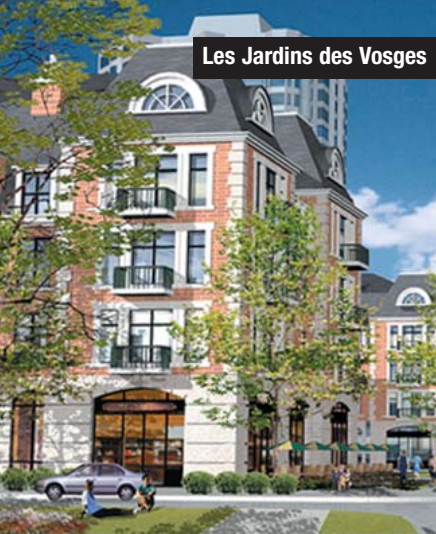
Les Jardins des Vosges

L'Association provinciale des constructeurs d'habitations du Québec (APCHQ) vient de décerner à la Corporation Proment le titre convoité de « Constructeur de l'année » pour l'année 2003. Cette fois-ci, la Corporation Proment remporte le titre pour les projets du Domaine de la Pointe, des Jardins des Vosges et des Sommets sur le Fleuve, totalisant au-delà de 100 millions de dollars pour la construction de plus de 300 unités d'habitation à l'Île des Sœurs.