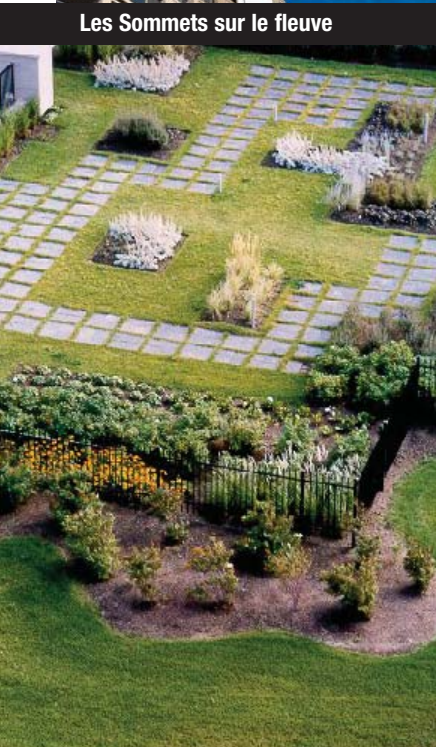
Les jardins des Sommets sur le fleuve